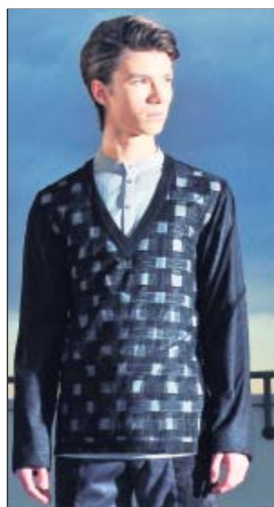
Ein Puller mit geraden Linien und Formen aus Plauener Spitze.