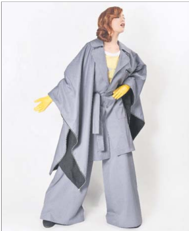
Die beiden Modelle sind aus Ellrichs aktueller Kollektion ...