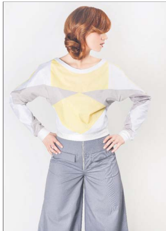
...aber ohne Spitze. Deren Design ist noch geheim.