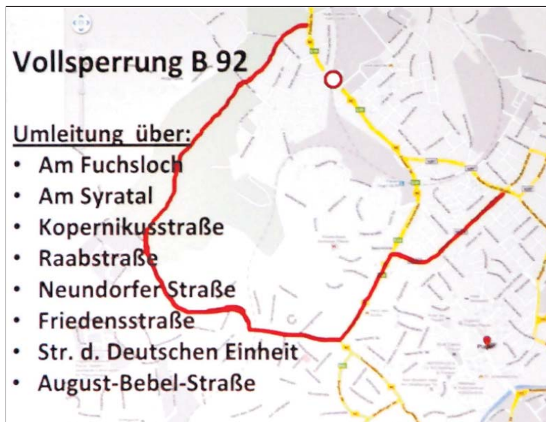
Auf eine größere Umleitungsstrecke müssen sich Ortsunkundige ab 12. Februar einstellen. Ab diesen Tag beginnen die Bauarbeiten für den Brückenbau auf der Pausaer Straße.

Bis 2013 soll die Strecke bis Hof elektrifiziert sein. Noch folgen muss allerdings die Strecke zwischen Nürnberg und Hof. Wann hier das Stromkabel gezogen werden kann, ist noch unklar. mar